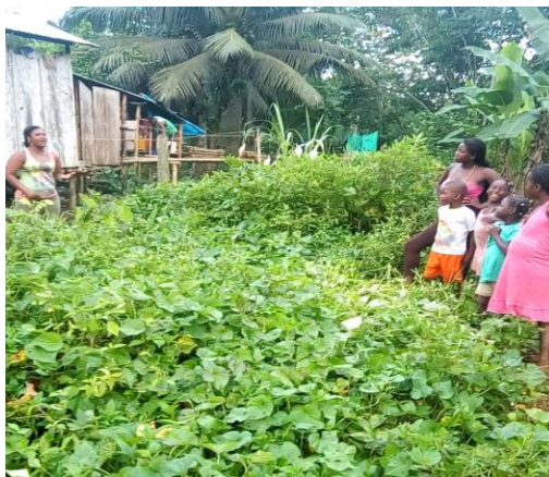
Ilustración 4 Planta medicinal El Chivo

cuentos, chistes, versos, decimas, conversatorios y en las actividades cotidianas como las mingas y las lavanderías a orillas de los ríos, todas estas expresiones culturales han hecho posible que se conserve nuestros saberes ancestrales como también el uso, manejo y aprovechamiento de la planta medicinal el chivo. Se entre lazan todos estos conocimientos como herramienta estrategia pedagógica. Para la articulación entre la tradición oral y la educación, para que la formación del educando comience desde sus raíces, explore el mundo exterior y reafirme su identidad cultural.