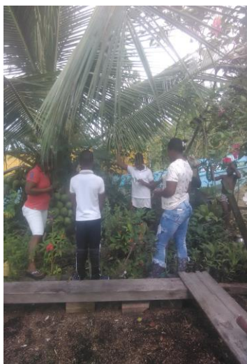
Ilustración 5 Salida de campo