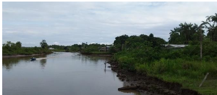
Ilustración 1 Comunidad Bocas de Guaba