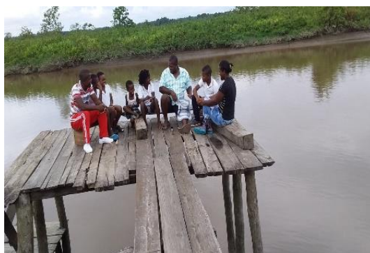
Ilustración 6 Salida de campo