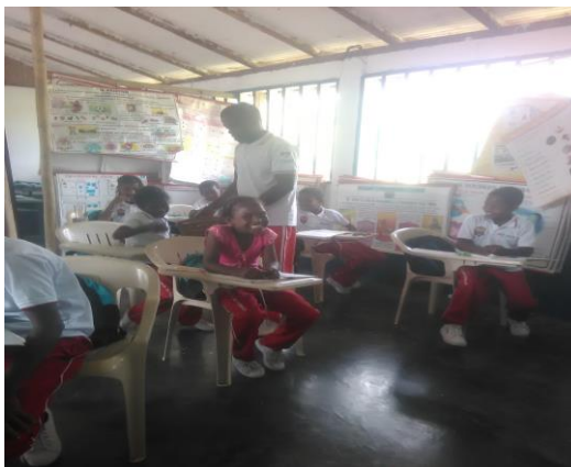
Ilustración 8 Actividad en el salón de clases