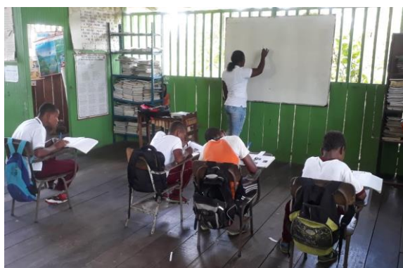
Ilustración 7 Actividad en clase