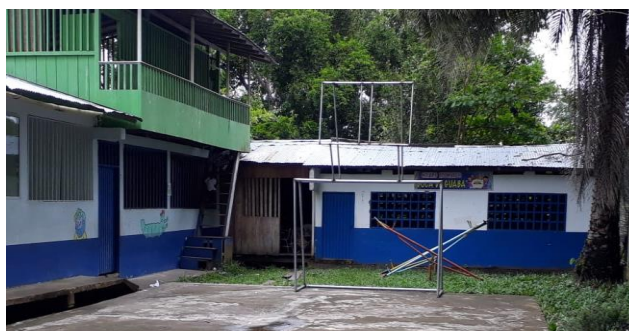
Ilustración 3 Centro Educativo Bocas de Guaba

Se cuenta con un contexto cultural donde se realiza actividades, como valsada, velorio, Chigualo, bautizo, fiestas patronales, bailes, bambuco, currulao, esto hace parte del contexto cultural y característica social de bocas de guaba el cual su población es afro. El centro educativo Bocas de Guaba ha venido trabajo asociado a la Institución Educativa La Inmaculada, hay dos docente y 60 estudiantes desde grado 0 hasta 5 de primaria, hay falencia en cuanto a la llegada a los niños, porque la vía de acceso es fluvial y no hay transporte para recoger los niños.