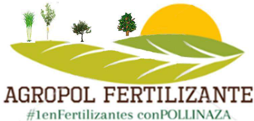
Imagen 5. Logo del proyecto

Nuestro producto será identificado en el mercado como Agropol Fertilizante . Se empacará en costales de fibra, llevará en su cara anterior un rótulo, que de acuerdo a la Resolución 5109 de 2005 del Ministerio de Protección Social, sobre normas de etiquetado y rotulado de productos orgánicos (Diario oficial, 2006), tendrá impresa la siguiente información: