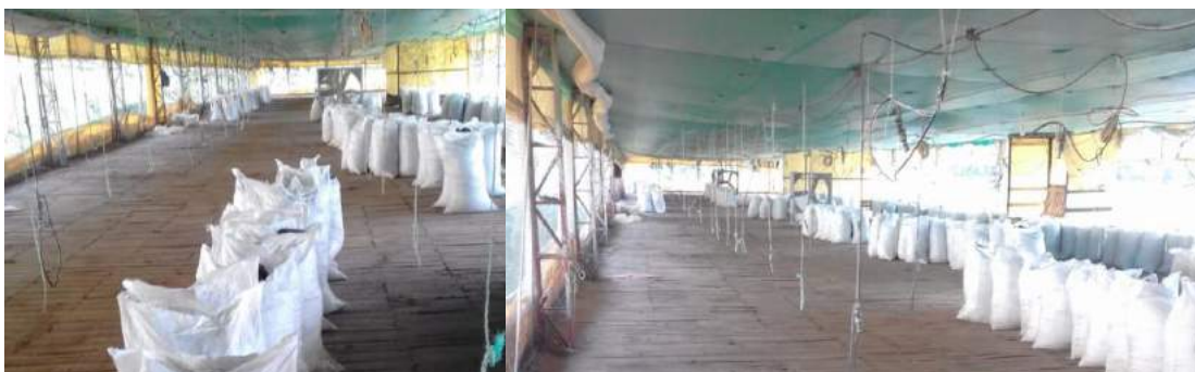
Imagen 3. Instalaciones

Las instalaciones deben contar con una excelente ventilación para que se evacuen los gases, olores y amoníaco que se genera durante su almacenamiento, libre de goteras y humedades ya que esto puede generar la descomposición y malos olores del producto. En este caso las instalaciones son los mismos galpones donde se produce, ya que en ellos se realiza todo el proceso de recolección y distribución hacia los diferentes clientes.