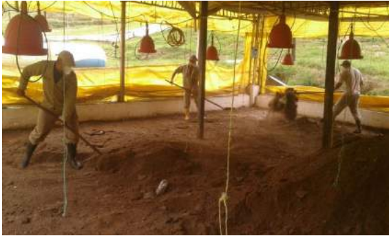
a. Remoción de la cama