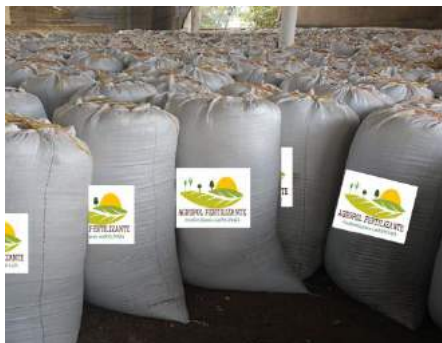
Imagen 2. Empaque para distribución

Este se realiza después de cumplido el proceso de sanitización por los operarios en costales de fibra debidamente rotulados con un peso neto de 40 kilogramos. (Imagen 2)