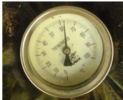
d. Control de temperatura