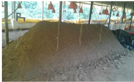
b. Pila de un metro de altura