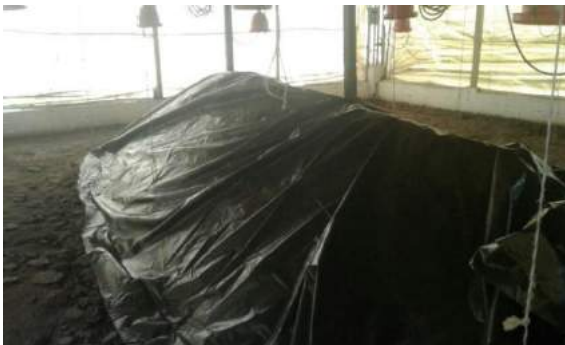
c. Cubierta de plástico negro para elevar temperatura